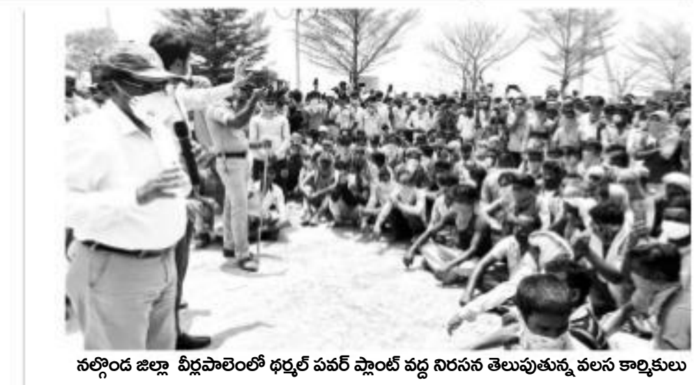
నల్గొండ జిల్లా వీరపాలెంలో ధర్మ పతర్ ప్లాంట్ వద్ద నిరసన తెలుపుతున్న వలస కార్మికులు

ప్రజాశక్తి - హైదరాబాద్ బ్యూరో లాక్డౌన్ నేపథ్యంలో చిక్కుకుపోయిన వలస కూలీలను సాంతాక్షకు పంపించేందుకు చర్యలు తీసుకోవాలని అధికారిత్వంలో వేలాది మంది కార్మికుల కోరికలు. తమన తమ తమ స్వల్పంగా పంపించాలని ఆందోళన బాట పట్టారు.