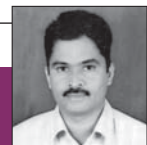
రచయిత అమరనేని కృష్ణ విషయ నిపుణులు